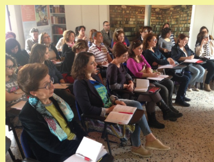
I corsisti durante una lezione presso il Centro Pastorale Francese per il dialogo e la pace di Comiso.

Il successo registrato di critica e pubblico dà anzitutto prova di aver