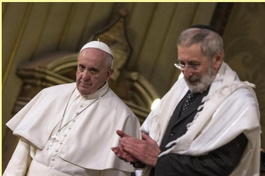
Papa Francesco e il Rabbino Laras presso la sinagoga di Roma, il 17 Gennaio 2016.

niera stretta; dobbiamo riconoscere che tra di noi c'è un legame che con altre religioni nessuno dei due ha e quindi siamo due popoli strettamente legati. Proprio questo dialogo ha favorito un interesse nuovo da parte degli ebrei nei confronti dei vangeli: nel '900 si sono moltiplicati gli studi di ebrei sui vangeli e leggendoli hanno espresso il loro punto di vista su Gesù e il suo insegnamento riconoscendo, tra l'altro, che non c'è nulla in contrasto tra ciò che Gesù insegna e la tradizione rabbinica; la vera differenza è il suo mistero pasquale e il suo riconoscimento come Dio incarnato da parte cristiana, ma come ricordava Martin Buber la fede di Gesù come uomo ebreo ci unisce, è la fede in lui che ci divide e questa è una verità di fronte alla quale da entrambe le parti dobbiamo fare i conti.