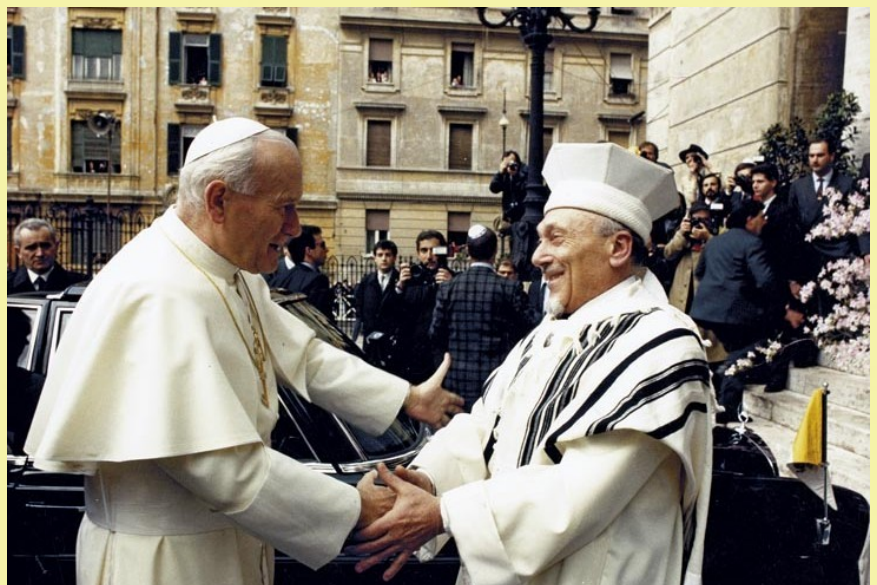
Incontro tra papa Giovanni Paolo II e il Rabbino Capo di Roma Elio Toaff (13.4.1986)

Sicuramente il prendere atto degli orrori prodotti dalla Shoah nei