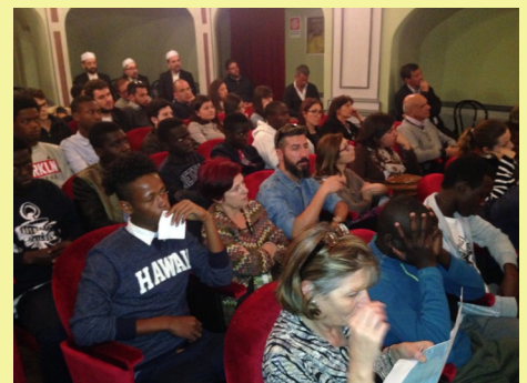
Pubblico presente, tra cui giovani profughi della Casa delle culture di Scicli