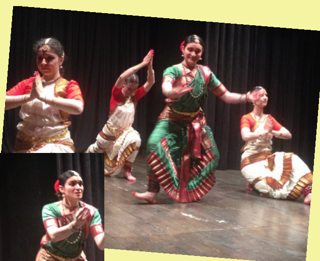
Le danzatrici del gruppo Atmananda e Talavidya Academy con maestria hanno rappresentato danze tipiche della cultura indiana