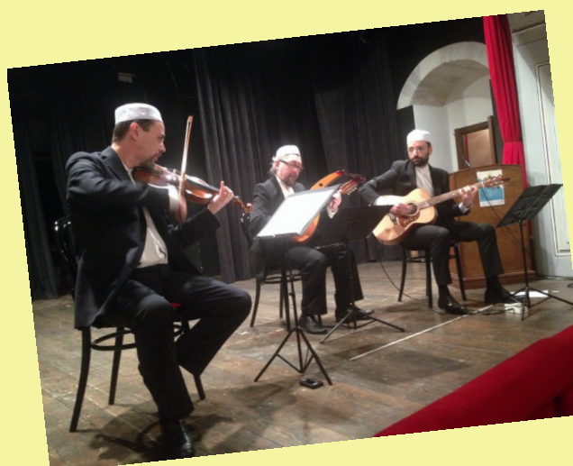
I musicisti della Sukun Ensemble hanno suonato dei brani tipici della tradizione islamica rielaborati

Teatro Donnafugata - Via Pietro Novelli 3 - Ragusa